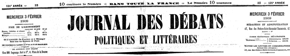
FIGURE 1.6 – Le Journal des débats du 3 février 1909.

Dans son discours d'intronisation à l'Académie française le 28 janvier 1909, Frédérique Masson (1847-1923) ironise sur son nom comme le rapporte le Journal des débats politiques et littéraires du mercredi 3 février. Le surlendemain un article de ce même journal indique qu'il avait été signé par un mystérieux A. T. (qui n'est autre qu'Antoine Thomas).