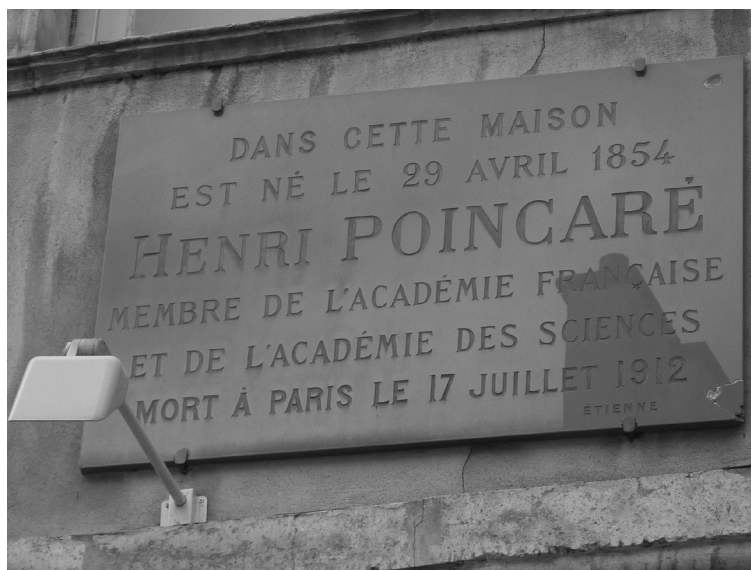
FIGURE 1.1 – Plaque commémorative sur la maison natale d'Henri Poincaré.

« Dans cette maison est né le 29 avril 1854, Henri Poincaré, membre de l'Académie française et de l'Académie des Sciences, mort à Paris le 17 juillet 1912. »