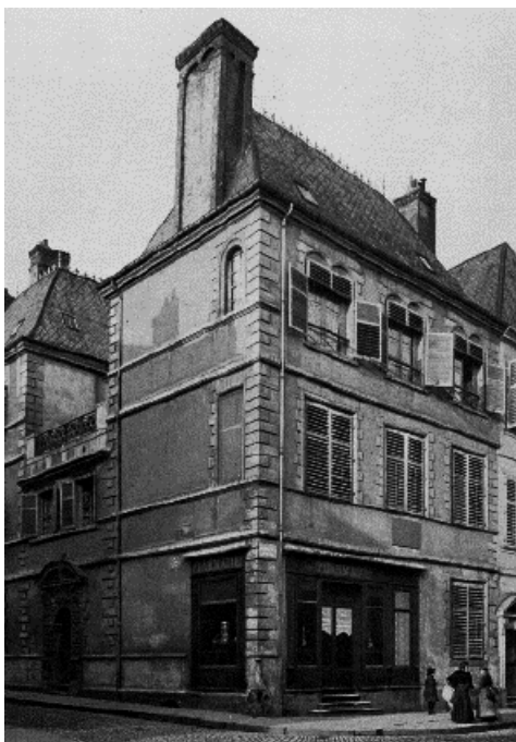
FIGURE 1.4 – Maison natale d'Henri Poincaré.